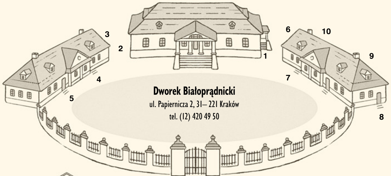
Dworek Biało-prądnicki ul. Papiernicza 2, 31–221 Kraków tel. (12) 420 49 50